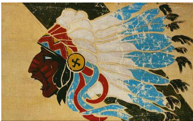
La tête de sioux, celle d'un chef Séminole, ornant les appareils de l'Escadrille La Fayette, est apparue en octobre 1916.

Au début de la première guerre mondiale, Blaise Cendrars (1887-1961), écrivain français d'origine suisse, fit paraître dans la presse un manifeste appelant les étrangers résidant en France à s'engager dans l'armée française.