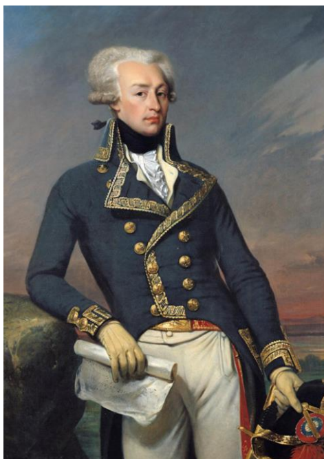
Le marquis de La Fayette, en uniforme de lieutenant-général de 1791 peint par Joseph-Désiré Court en 1834