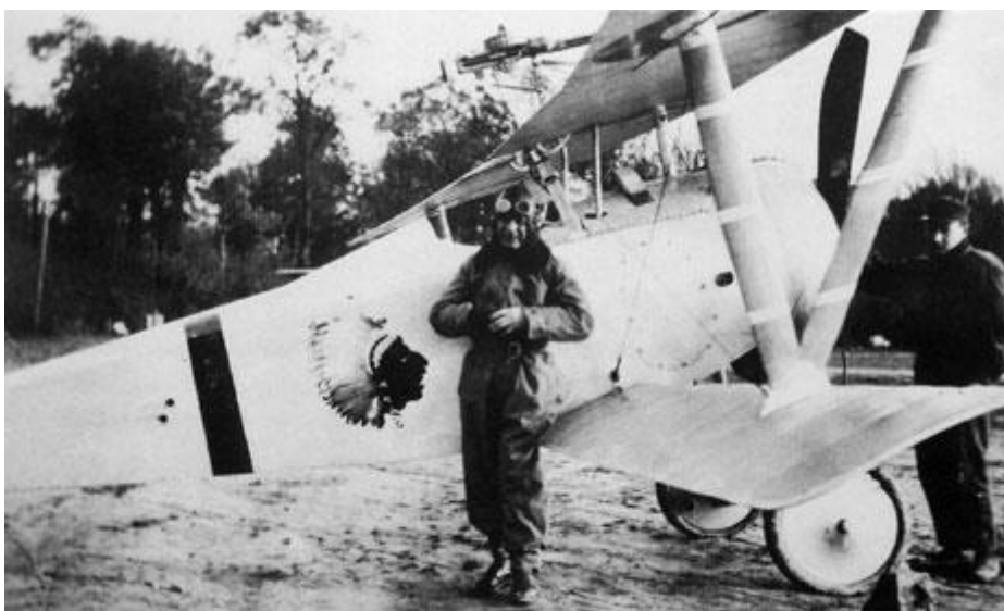
Le Sgt Robert Soubiran pose à côté de son Nieuport 17 sur le terrain de Cachy en décembre 1916 - Photo SHD du château de Vincennes.

L'Escadrille La Fayette cessa d'exister dans sa forme originale le 18 février 1918. Elle devint alors la N 103, la première escadrille de chasse américaine.