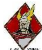
SPA 96 Gaulois « Limousin »